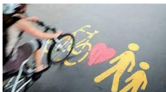
Attivi per mobilità attiva praticata per caratteristiche socio-demografiche e stime di popolazione Molise