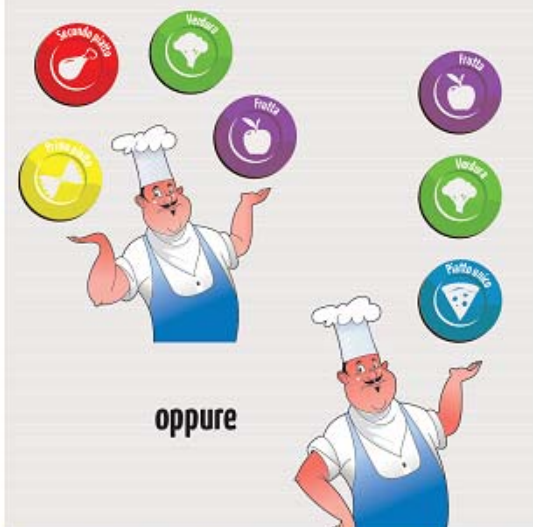
Iniziativa "Codice colore" (buona pratica 1.5); Cartello per la mensa tratto dagli allegati 1F.

(*) Se è presente una mensa aziendale; in caso contrario diventano obbligatorie la 1.2 o la 1.3. Se l'Azienda non è dotata di mensa, né di area di refezione, né di distributori automatici di alimenti, si dovranno scegliere 3 altre buone pratiche.