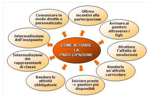
Fig. 2 Strategie di partecipazione dei genitori e dei bambini