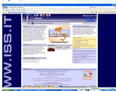
Figura 4. "Osservatorio Nazionale per il Monitoraggio della Iodioprofilassi in Italia (ISS)

Inoltre è stata attivata una stretta collaborazione con l'Osservatorio Nazionale per il Monitoraggio della Iodioprofilassi (www.iss.it/osnami) che prevede lo sviluppo di attività di formazione per gli operatori del settore alimentare (Figura 4).