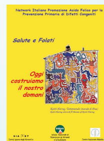
Figura 2. Booklet "Salute e folati" (Sianet - INRAN - ISS)

L'esperienza ed i risultati ottenuti dimostrano la praticabilità di azioni di comune interesse attraverso la collaborazione tra Sian e Società di Gestione della Ristorazione Collettiva con il supporto scientifico di ISS e INRAN. È pertanto di fondamentale importanza perseguire azioni condivise, pianificate e sistemiche che permettano di raggiungere gli obiettivi prefissati in una materia che ha acquisito grande rilevanza sanitaria, economica e sociale.