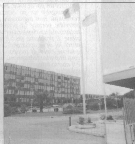
La sede del Ministero dell'Economia e delle finanze, in viale Nervi. Dopo la denuncia dei dipendenti i rilievi di Asl e Vigili del fuoco hanno confermato