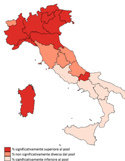
Consumatori a maggior rischio Pool di Asl, PASSI 2012 (%)

**il denominatore comprende tutti i bevitori, anche quelli a cui un medico o altro operatore sanitario negli ultimi 12 mesi non ha chiesto se bevono