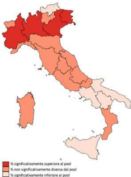
Guida sotto l'effetto dell'alcol tra i bevitori 18-69 anni che hanno guidato l'auto/moto negli ultimi 12 mesi Pool di Asl, PASSI 2012 (%)

Nel 2012 nella Regione Toscana e nel Pool di ASL, le percentuali di intervistati che hanno guidato sotto effetto dell'alcol sono, rispettivamente, del 9,7% e 10%.