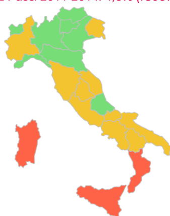
Diabete Prevalenze per regione di residenza Pool di ASL Passi 2011-2014: 4,3% (IC95%: 4,1-4,4%)

■ peggiore del valore nazionale ■ simile al valore nazionale ■ migliore del valore nazionale