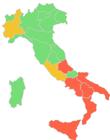
Sedentari Prevalenze per Regione di residenza Passi 2012-2015 Pool di Asl : 32,0% (IC95%: 31,7-32,3%)