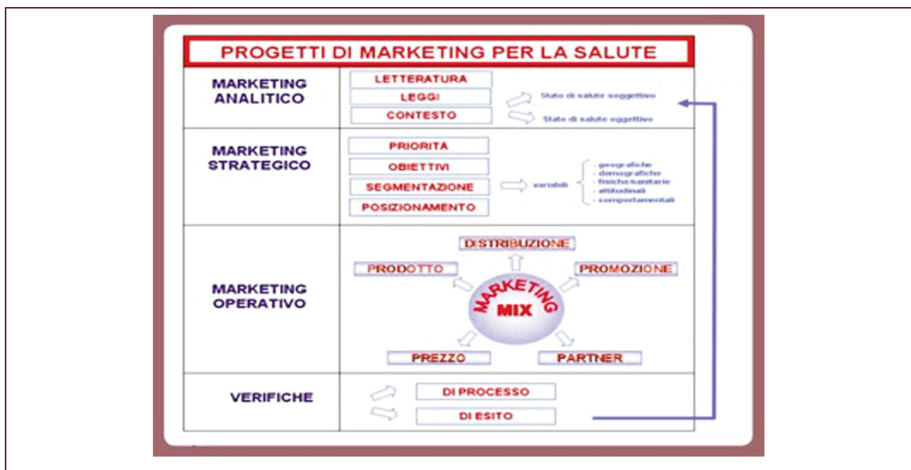
Le fasi di pianificazione del marketing sociale (G.Fattori et al. 2009)

Diverso è l'approccio alla misura degli esiti in termini di salute, sia perché questi spesso si rendono evidenti solo nel lungo periodo, sia perché possono essere la conseguenza dell'interazione di diversi fattori, alcuni dei quali indipendenti dal progetto realizzato.