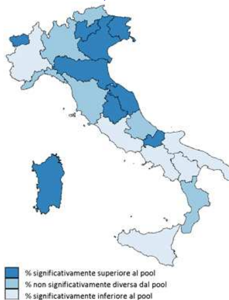
Controlli da parte delle Forze dell'Ordine negli ultimi 12 mesi Pool di Asl, PASSI 2010-12

La percentuale di intervistati sottoposti ad etilotest è stata del 10,8% nella ASL 2, del 12,9% in Toscana e dell'11,0% nel Pool di Asl.