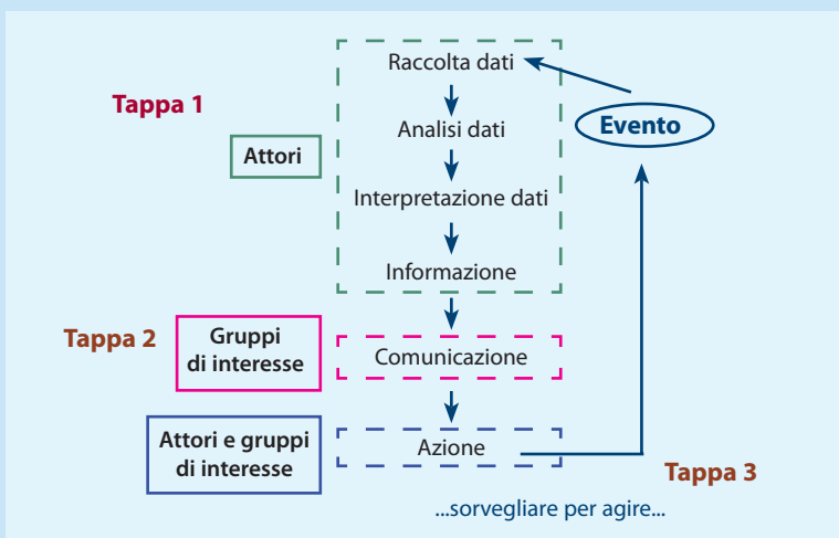
Figura - Schema della sorveglianza in salute pubblica

Tappa 1 - Per quanto attiene a questa tappa, gli attori regionali dovranno decidere quali siano le patologie o i fattori di rischio da includere nella sorveglianza, assumendo di tenere costante un nucleo ( core ) di variabili per i prossimi anni e per tutte le regioni (ad esempio, i fattori di rischio per la patologia cardio-vascolare) e di avere un gruppo di variabili che verranno misurate periodicamente e, in qualche caso, solo per alcune regioni (ad esempio, incidenti domestici). In questa tappa rimangono ancora da precisare e mettere a punto numerosi aspetti tecnici, dall'informatizzazione del sistema alla modalità di inserimento dei dati, dalla scelta di indicatori validi ma anche sufficientemente sensibili alle variazioni temporali. Questo ruolo, eminentemente tecnico-scientifico, verrà svolto nei prossimi anni dal CNESPS. ▶