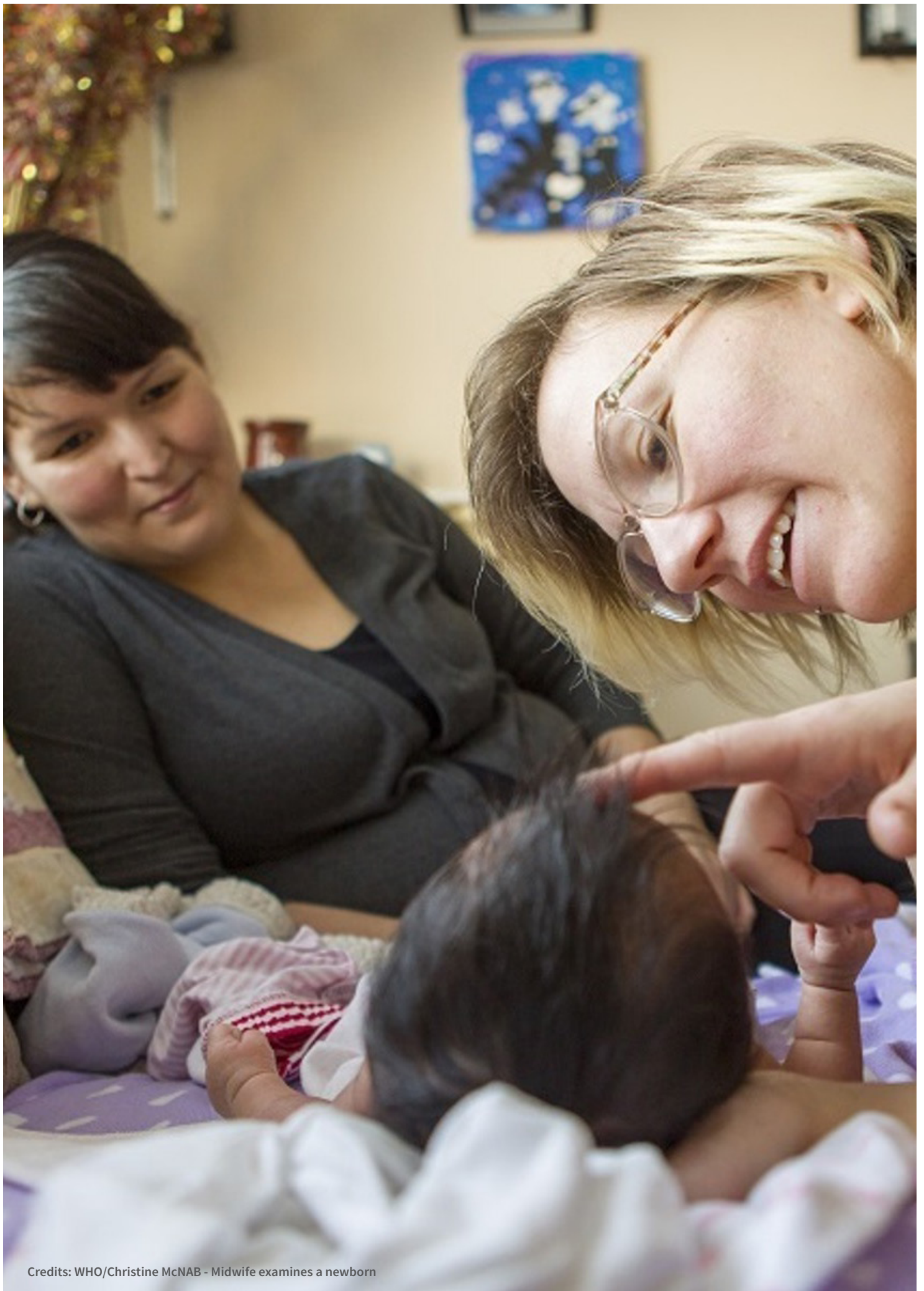
Midwife examines a newborn