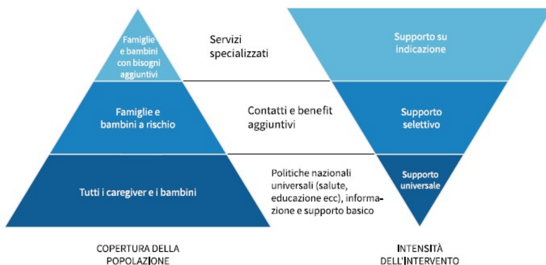
Figura 2 - Rispondere ai bisogni delle famiglie e dei bambini, Nurturing Care, WHO

Concentrarsi esclusivamente sui soggetti preventivamente definiti a rischio fa perdere delle preziosissime opportunità di intervento precoce su tutti gli altri, che comunque possono presentare vulnerabilità, e connota i servizi come servizi esclusivamente per persone o nuclei in difficoltà