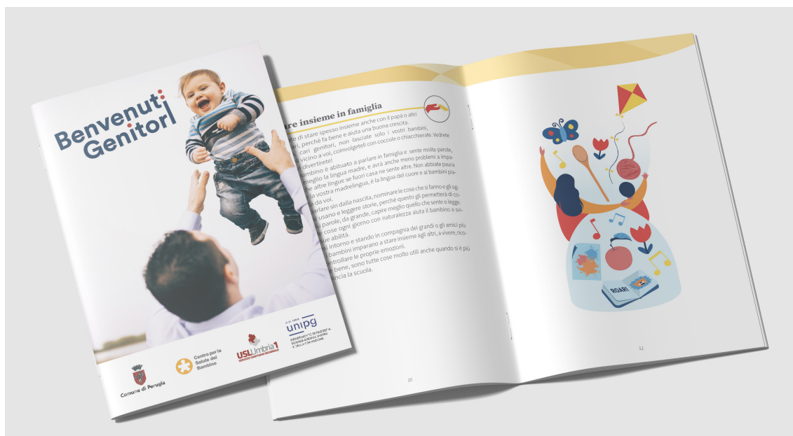
Figura 4. Progetto Benvenuti Genitori

Il piano comunicativo ha inoltre previsto e prodotto dei podcast, resi disponibili sia sul sito del Comune che di altri Enti e associazioni. Gruppi informali e associazioni possono infatti essere invitati a collaborare veicolando l'informazione sui loro canali (siti e chat).