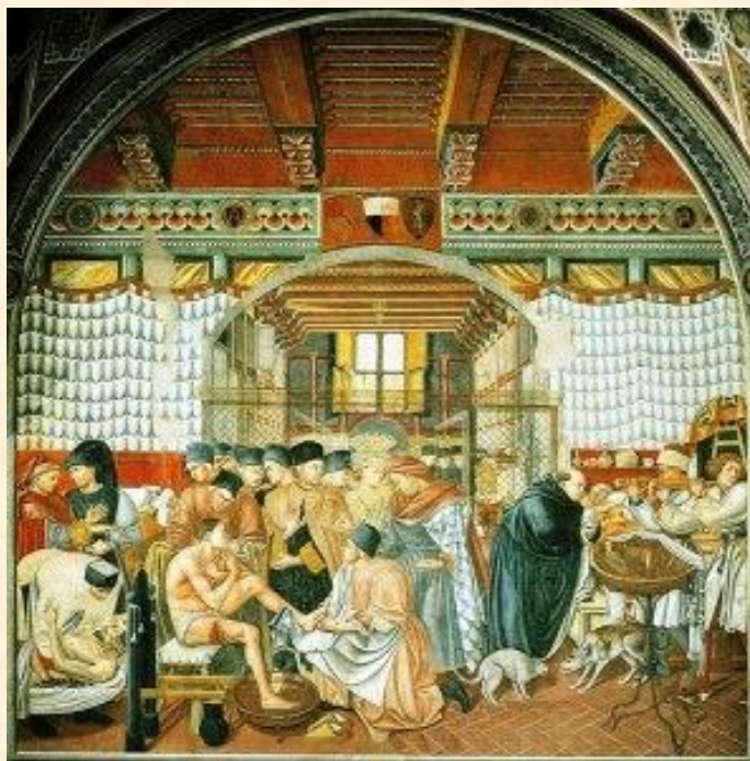
Domenico di Bartolo – “Il governo e la cura degli infermi” – 1441 Pellegrinaio, S. Maria della Scala - Siena