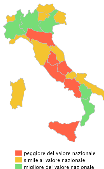
Fumatori per regione di residenza Passi 2012-2015

Nell'ASL VCO sono il 27% delle persone tra 18 e 69 anni fuma, il 22% è ex-fumatore ed il 51% non ha mai fumato.