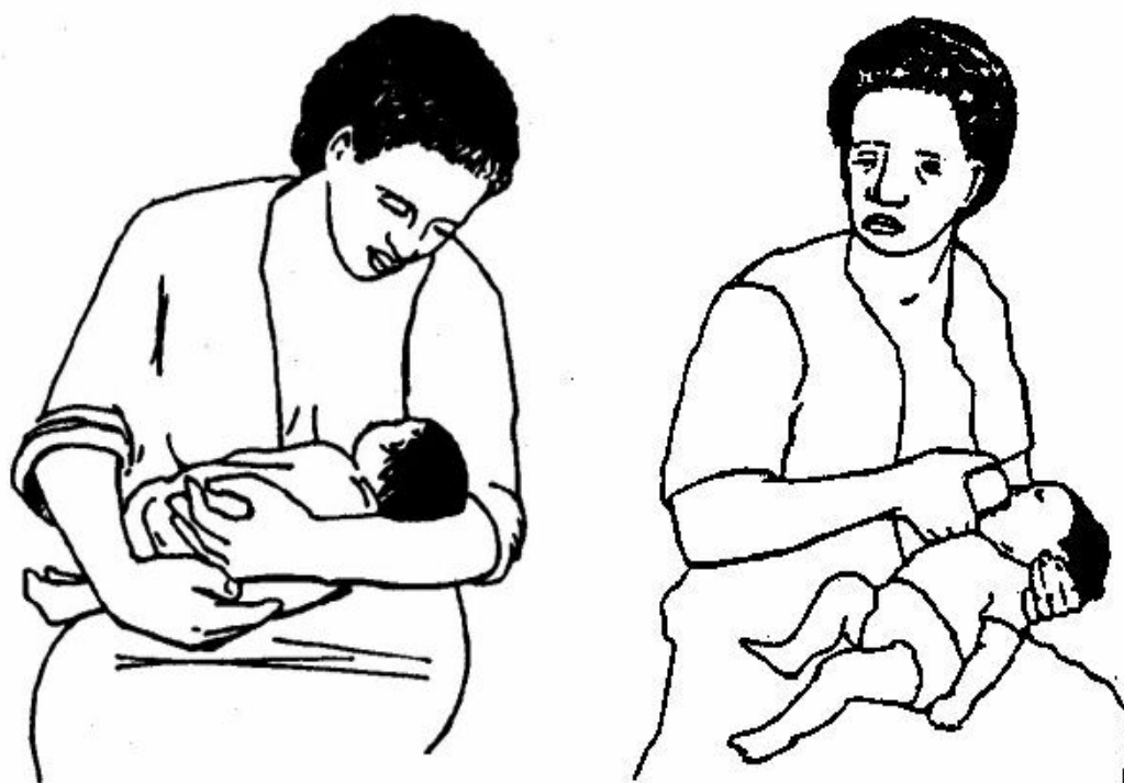
Figura 17 Osservate come la madre tiene il bambino

a. il corpo del bambino stretto al suo, di fronte al suo seno; lo guarda negli occhi