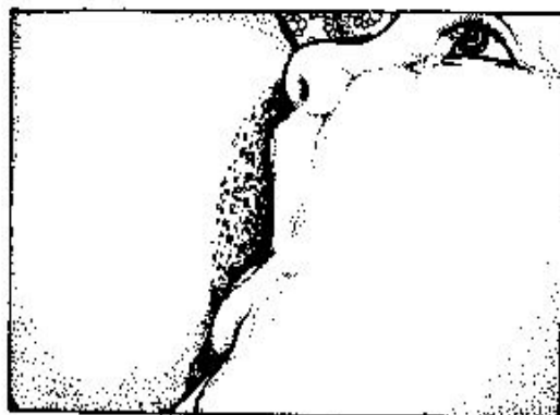
a. un bambino ben attaccato al seno