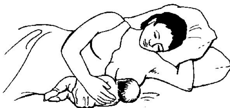
Figura 25 Una madre che allatta il suo bambino da sdraiata