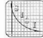
Figura 1. Schema DFPV (dati di base - fattori di rischio - prevenzione - valutazione) (da Taggi, 1999b)